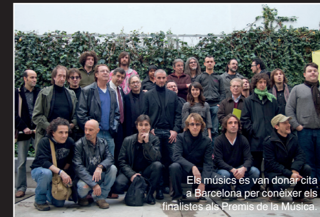
Els músics es van donar cita a Barcelona per conèixer els finalistes als Premis de la Música.