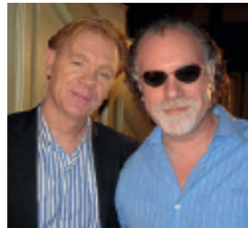
L'actor català amb David Caruso, l'Horatio Caine de "CSI Miami".